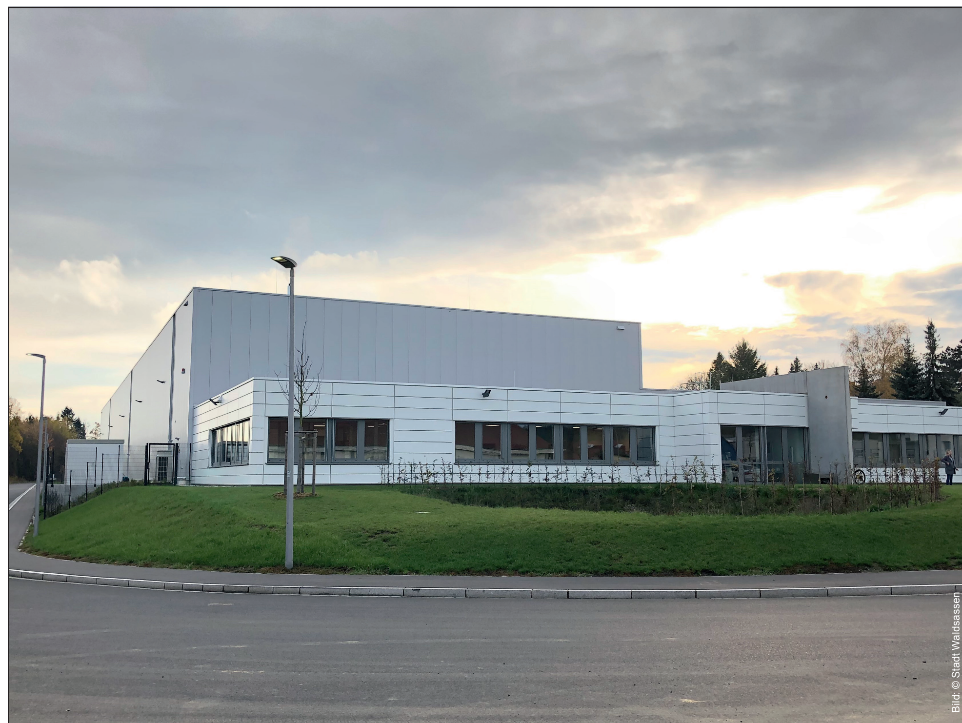
Brachen weichen und schaffen Platz für Neues