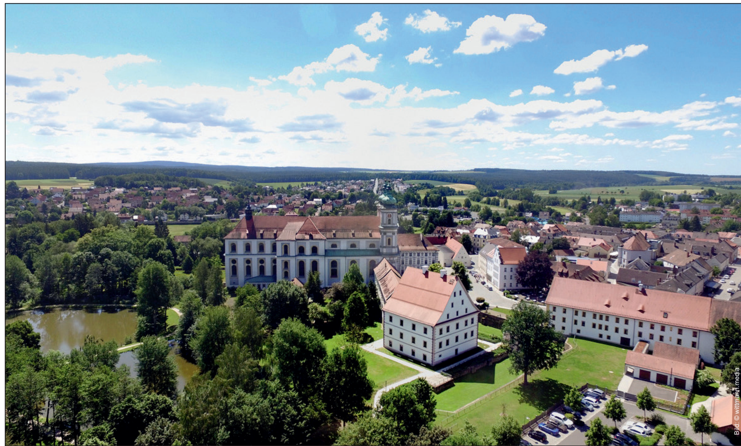
Blick auf die Altstadt Waldsassen

Bürgerbeteiligung als Erfolgsrezept Jede Maßnahme wird von der Idee, über die Projektierung, in der Umbauphase und natürlich bei Fertigstellung im intensiven Dialog mit den Bürgern perfektioniert. Hohe Akzeptanz ist die Folge.