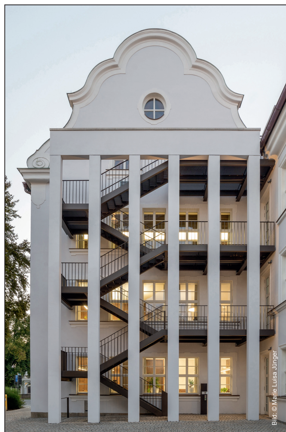
Rückseite Rathaus Waldsassen