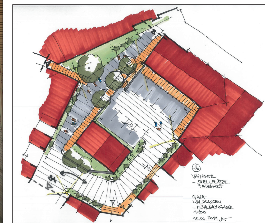
Freiflächen schaffen im Mühlenviertel