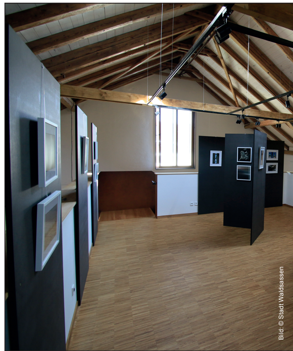
Kunsthaus im ehemaligen Stodl

Waldsassen im Wandel Fast jährlich wird ein größeres Projekt im Rahmen der Städtebauförderung in Waldsassen umgesetzt. Vieles ist erledigt, dennoch bleibt einiges zu tun.