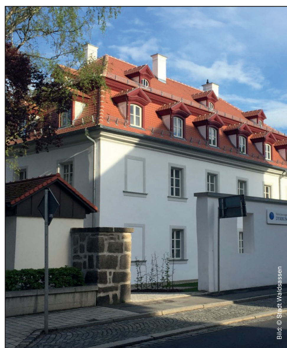
Ehem. „Deutsche Schule“ - Wohnen in der Altstadt