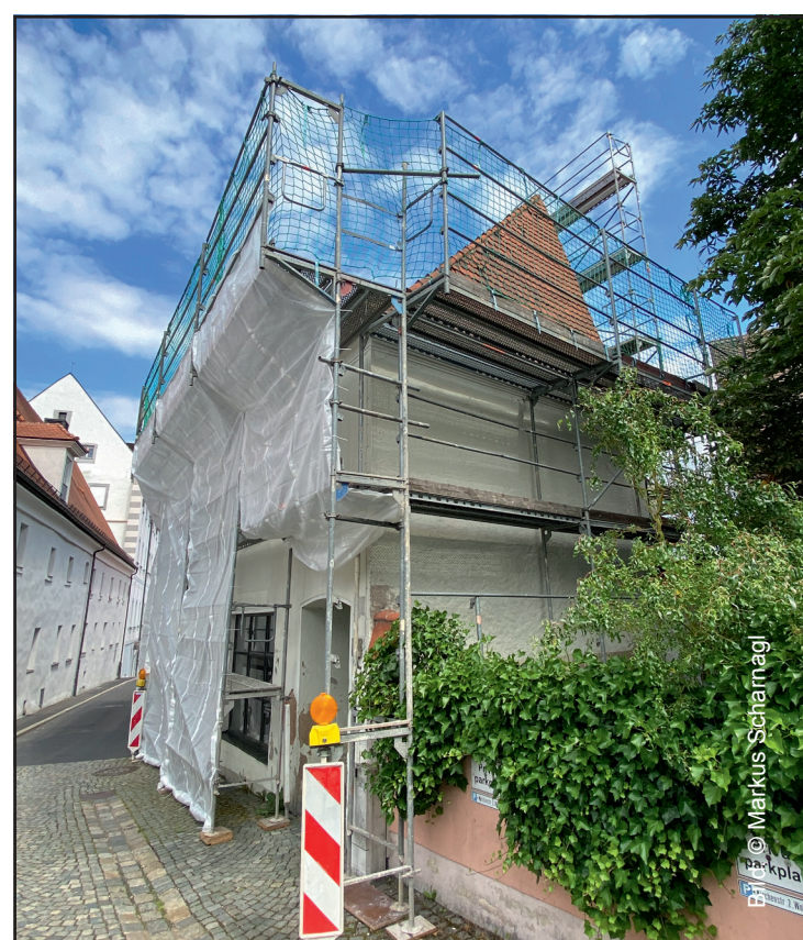
Wohnen in der Altstadt