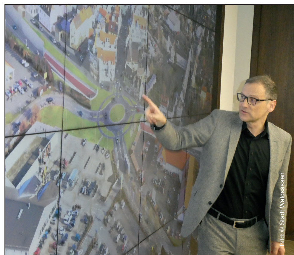
Bürgermeister Sommer im Bürgerdialog