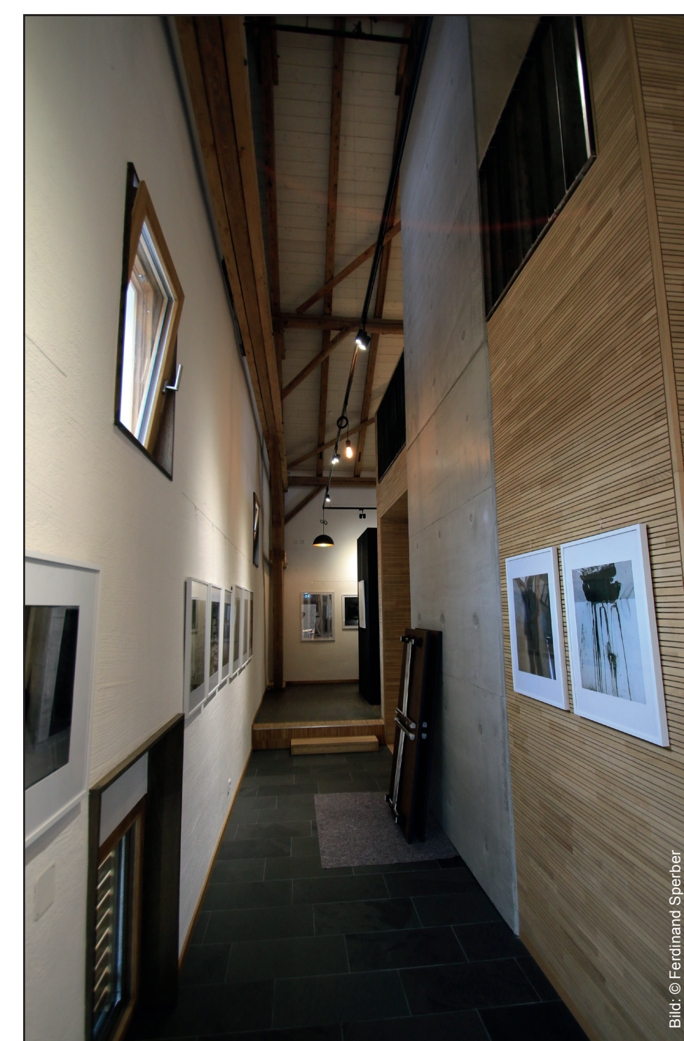
Blick ins Kunsthaus