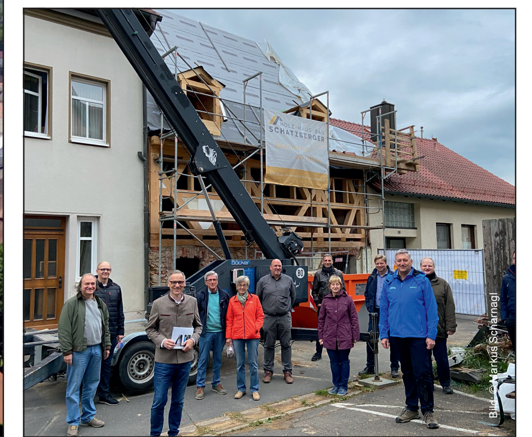
Bürgerbeteiligung als Erfolgsrezept

Bürgerbeteiligung als Erfolgsrezept Jede Maßnahme wird von der Idee, über die Projektierung, in der Umbauphase und natürlich bei Fertigstellung im intensiven Dialog mit den Bürgern perfektioniert. Hohe Akzeptanz ist die Folge.